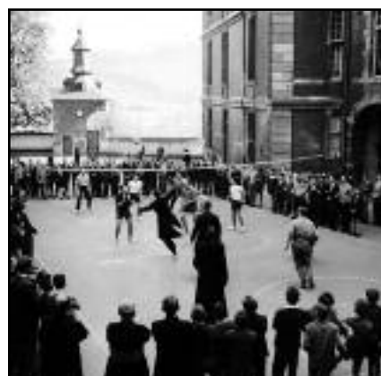
Dans la cour carrée, en 1955, match de volley entre professeurs et élèves.