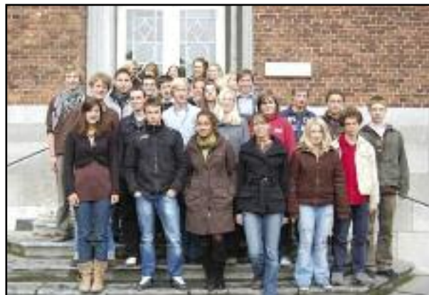
...et la rhéto « 6ème C » 2009, qui comptait 27 élèves (il y avait 5 classes de rhéto en 2009).

Nous avons gardé dans notre école des archives très intéressantes : des films, des documents et des objets anciens, des cartes postales, des photos sur lesquelles pourront se reconnaître plusieurs générations d'élèves. Tous ces témoins du passé nous donnent l'occasion d'évoquer 190 ans d'une école, au travers d'une exposition et d'un concert dont nous vous donnons ci-dessous les thèmes et les dates.