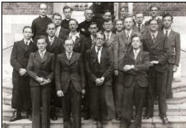
La rhéto de 1942, qui comptait en tout 16 élèves...

Mais aujourd'hui, en 2009, les « philosophes » (c'est-à-dire les élèves qui se préparaient pendant deux ans après les humanités à l'entrée en « théologie » au grand séminaire de Namur) ont quitté Floreffe depuis belle lurette – en 1967. L'école a gardé son ancien nom de « Petit Séminaire de Floreffe » et répand la « semence » de son enseignement à plus de 1 000 élèves d'humanités, filles et garçons mélangés.