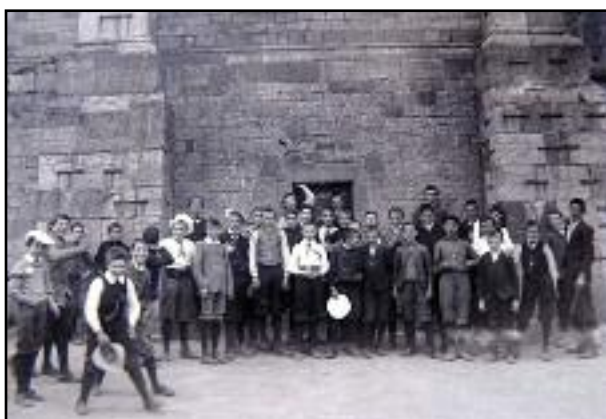
Elèves dans la cour de récréation au début des années 1900.

Plus de renseignements : www.semflo.be (rubrique « Les anciens ») – bodsonsoye@yahoo.fr