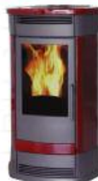
DUBLIN 12 Kw