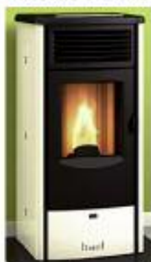
CLOÉ 6 Kw